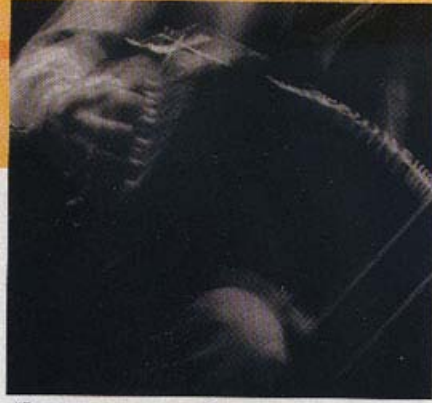
"FUE MUY GRANDE LA EMOCIÓN CUANDO ME SUBÍ POR PRIMERA VEZ CON SERRAT A UN ESCENARIO".

en el pecho. La música de este disco la empecé a escribir después del estallido de la gran crisis económica y moral que sufre mi país, en un primer momento pensé que esto era sólo patrimonio de la Argentina, pero poco después levante un poco la vista y me di cuenta que de una u otra manera esto es lo que pasa en todo el mundo, en todo lugar de este planeta. Poco tiempo después se comienza a hablar de guerras preventivas y todo lo que todos estuvimos, seguimos, y seguramente seguiremos escuchando lamentablemente, en todos los medios de comunicación, con respecto a esa guerra y sus beneficios. Hay masacres militares y económicas en la mayor parte del mundo. Sin hablar del desastre ecológico, que ya es visible en todos lados".